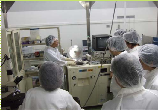
「MEMS実装実習(ウェハ接合技術)」 陽極接合 (産業技術総合研究所)