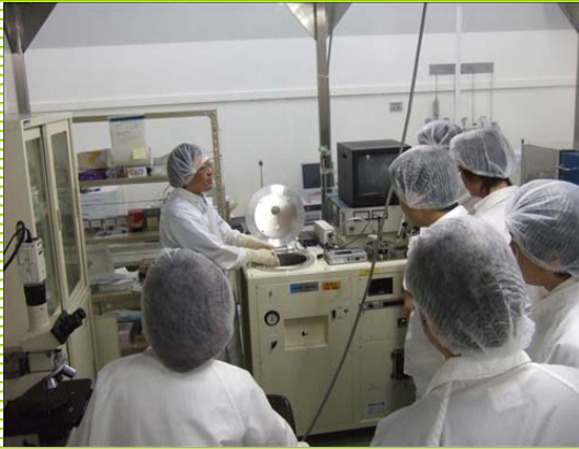
「MEMS実装実習(ウェハ接合技術)」 陽極接合 (産業技術総合研究所)