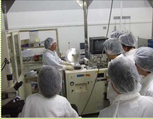
「MEMS実装実習(ウエハ接合技術)」 陽極接合 (産業技術総合研究所)