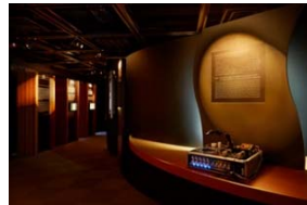
神経科学の基本概念を知る