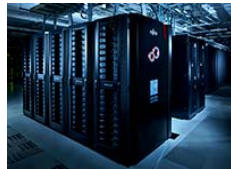
スパコンと4Dシアター