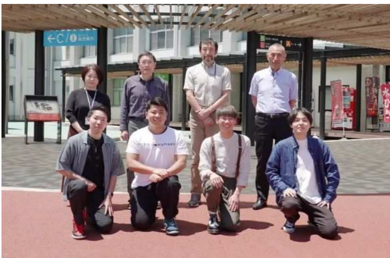
南信州・飯田サテライトキャンパス 学生・教職員（2025.4）

主な研究テーマ；CFRP（炭素繊維強化プラスチック）およびCFRTP（炭素繊維強化熱可塑性プラスチック）の成形技術開発、CFRTP等の切削加工技術開発、他