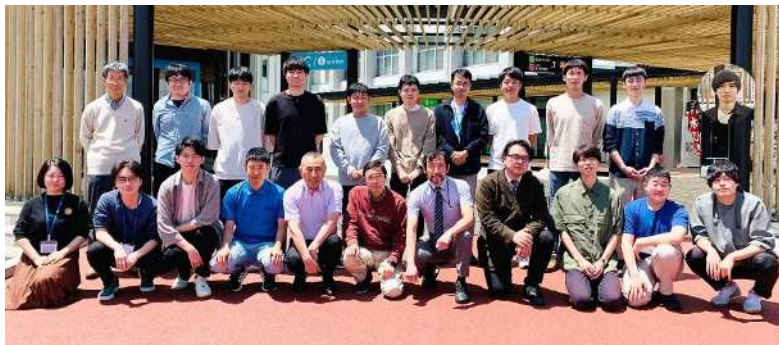
南信州・飯田サテライトキャンパス 学生・教職員（2023.4.1） 航空機システム共同研究講座、大学院航空機システム分野横断ユニット

電子情報システム工学分野専任、航空機システム分野横断ユニット併任、 航空宇宙システム研究拠点 基盤技術部門 専門；電気機器、エネルギー変換 主な研究テーマ；リニア発電機の開発とモバイルシステムへの応用、電 力変換、他