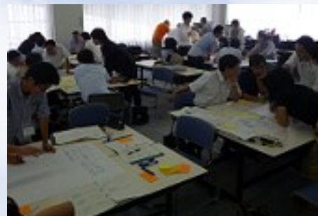
▲平成25年度FDカンファレンスにおけるグループワークの様子

*大学運営関連 …教員業績書の書きかた（11月から12月に締切） DPなど信州大学の教育方針の理解 大学の生産的な文化の育成 （男女共同参画・ワークライフバランス・人間関係の維持の方法）など