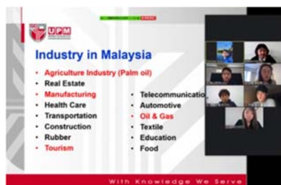
図：COIL型オンライン協働学習の様子

[1]末松和子(2019). 国際共修の検証 - 文献リサーチを通して見えてくるもの - 留学交流, Vol.95, pp.1 - 12