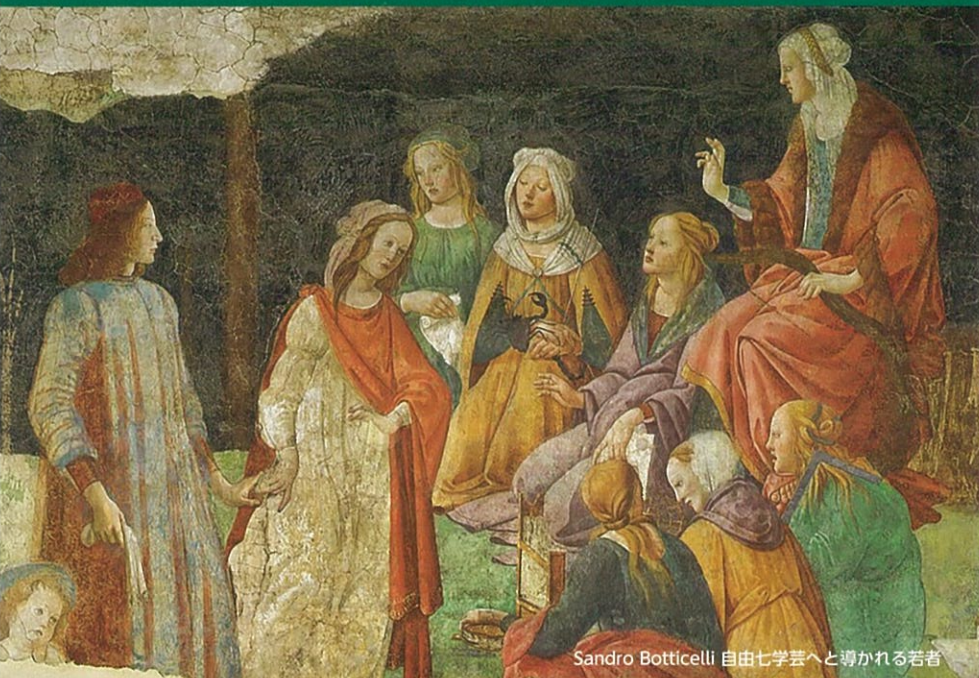
Sandro Botticelli 自由七学芸へと導かれる若者

日本の財界と芸術界のトップを迎え、またアートとサイエンス教育で先端を行く海外有力大学の取組代表者を講師として、グローバル化時代に求められる人材像を明らかにし、社会の信頼に応える大学教育のあり方を探ります。