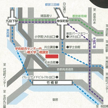
【一橋大学一橋講堂】

〒101-8439 東京都千代田区一ツ橋 2-1-2 学術総合センター内 東京メトロ半蔵門線、都営三田線、都営新宿線 神保町駅 (A8・A9 出口) 徒歩 4 分 ※ A8 出口は、近隣ビルの工事のため平成 25 年 10 月 5 日から 閉鎖しております。お越しの際には A9 出口をご利用ください。 東京メトロ東西線 竹橋駅 (1b 出口) 徒歩 4 分