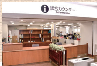
中央図書館総合カウンター