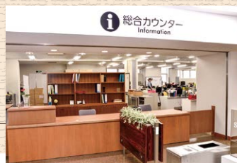
中央図書館総合カウンター