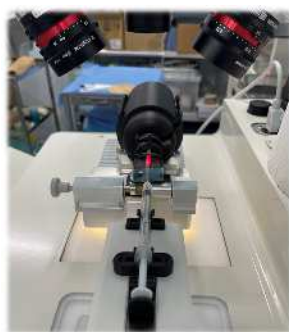
2台のカメラで確実に 静脈の位置を認識