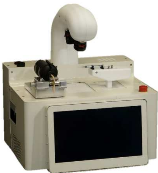
操作はタッチパネル式で簡便。 コンパクトな可搬型システム

本セミナーではAUTivの特長の紹介はもちろんのこと、動画を用いることで分かりやすく操作手順や穿刺について紹介していただきます。