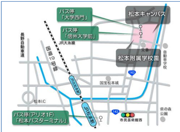
松本キャンパスアクセスマップ