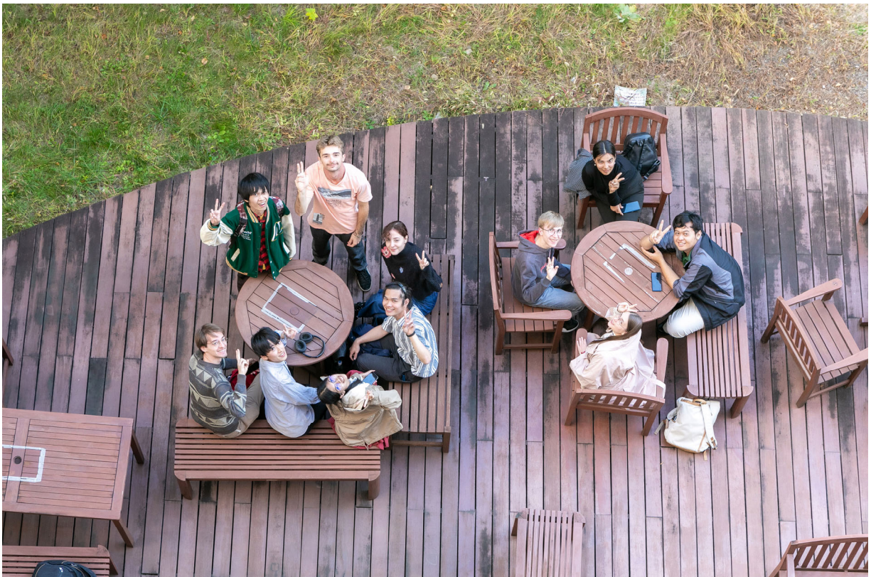
(松本キャンパスの風景)