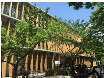
松本キャンパスの中央図書館

信州大学は8学部（人文、教育、経法、理、医、工、農、繊維）、5大学院研究科（総合人文社会科学、教育学、総合理工学、医学系、総合医理工学）を擁する総合大学です。松本・長野・上田・伊那に5つのキャンパスがあり、学部学生約9,000名、大学院生約2,000名、計約11,000名が学んでいます。そのほかにグローバル化推進センター、6つの研究領域で特色のある最先端の研究を行う先鋭領域融合研究群などの教育・研究施設があります。キャンパスのある各地域は、豊かな自然環境と伝統ある教育環境に恵まれ、独自の発展をみせています。