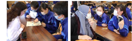
附属中学校での国際共修

大学近くにある教育学部附属幼稚園・小学校・中学校の授業に深く参画します。児童・生徒と定期的に会って交流しつつ日本の初等教育について学び、皆さんの国の教育を児童・生徒に伝えます。