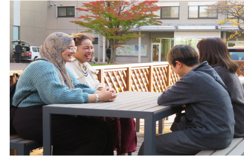
キャンパスで談笑する学生たち