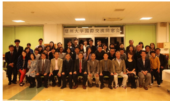
国際交流同窓会・松本の様子

修了生の中には大学教員になっている人もおり、その修了生の勤務する大学と信州大学の大学間交流協定締結が実現したり、その大学から新たな日研生が来学するなどの成果があがっています。また、卒業後に長野県の企業に就職し、母国と長野県の懸け橋になっている者や、休暇で松本を訪問し、自分が勤める会社について日本人学生にプレゼンをする者もいます。