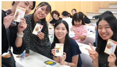
ガイダンスに出席する新入留学生とチューター

日本人学生がチューターとして、皆さんをサポートします。来日時の煩雑な手続きや学習面、生活面の相談相手、観光スポットの紹介など頼れる相談相手です。