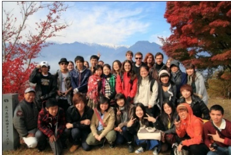
安曇野での日本人との交流会

グローバル化推進センターが開講する授業については、ホームページで詳しく調べることができます。