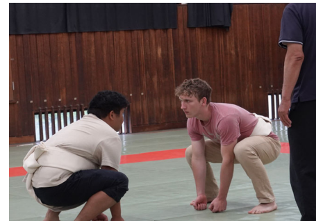
「武道・伝統文化実習」の授業