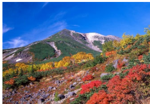
紅葉の北アルプス

日本語・日本文化研修留学生(以下、日研究生)が学習する松本キャンパスは、日本の中心にあるため、東京・名古屋から電車で2時間30分、大阪からでも3時間30分と大都市への移動も簡単です。