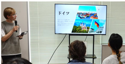
日本人学生に母国・母校を紹介