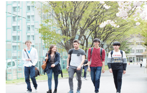
キャンパスを歩く留学生と日本人学生