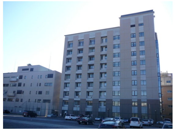
信州大学旭総合研究棟

信州大学松本キャンパスの正門を入り、150mほど直進した正面にある、9階建ての建物です。信州大学内に駐車場はございませんので、公共交通機関をご利用ください。 http://www.shinshu-u.ac.jp/guidance/maps/map05.html