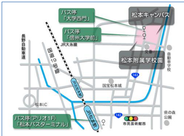
松本キャンパスアクセスマップ