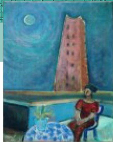
モスクの見えるテラス