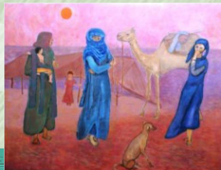
トゥアレグキャンプ