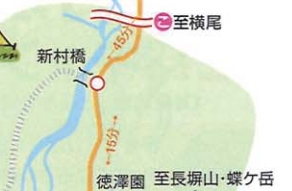
7 横尾山荘 13 横尾山荘