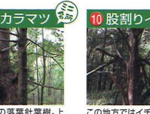
日本で唯一の落葉針葉樹。上高地の唐松は天然自然のもの。