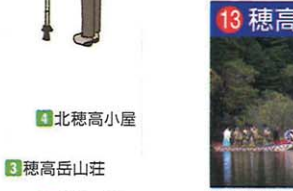
本宮は安曇野市穂高、奥宮は奥穂高岳(明神岳)。10/8は奥宮のお船まつり。