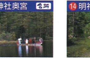
荘厳な雰囲気を持つ湧水豊富な池。穂高神社神域のため拝観料300円。