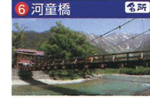
昔は河童淵と呼ばれていた場所。芥川龍之介の小説「河童」に登場。