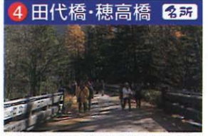
ところどころの解説版が周りの自然をやさしく解説してくれる。