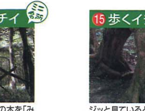
この地方ではイチイの木を「みねぞ」と呼びます。