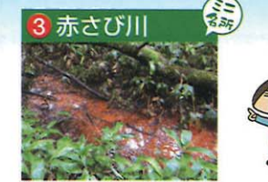
鉄分やマンガンが溶けている小川。