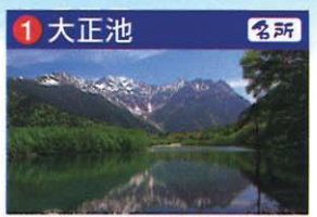
大正4年の焼岳噴火により梓川がせき止められ一夜にできた池。