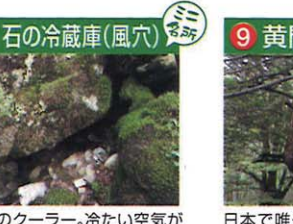
天然のクーラー。冷たい空気が岩塊の集まる穴から出ています。