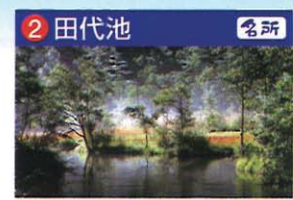
霞沢岳の湧水でできた湿原。ここからの霞沢岳や穂高岳の眺めは素晴らしい。