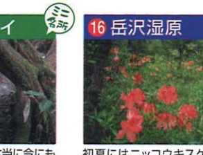
ジッと見ていると本当に今にも動き出しそうに見えます。