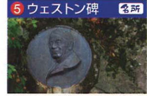
日本アルプスを世界に紹介した英国人宣教師ウェストンのレリーフがある。