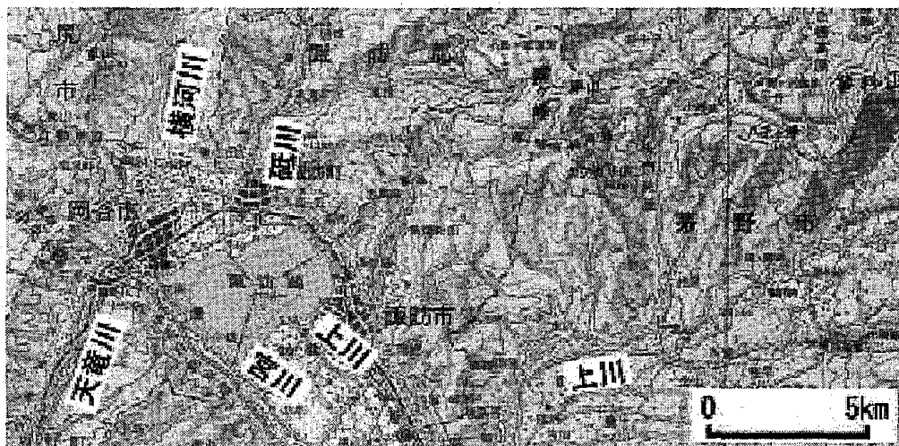
図1 諏訪湖へ流入する主な河川

の検討をおこなった。その結果、必ずしも上流域の水質が下流域より良いとはいえないこと、水質変化には農畜産排水系と事業所排水系の要因が大きいことを明らかにした(石澤, 1996)。ここでは、同様な分析手法を用い、天竜川流域の諏訪湖における水質変化の要因について考察してみたい。