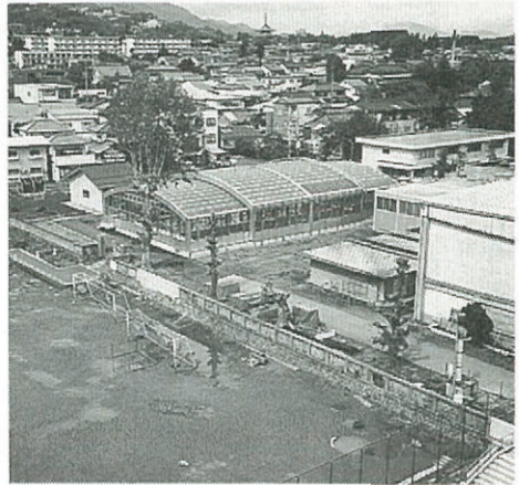
開閉可能な屋根付き25mプール

次に、学部改革の状況であります。少子化現象が進行し、教員需要が大幅に減少しているため、昨年四月十五日小杉文部大臣は財政構造改革会議のヒアリングの場で、教員養成課程の入学定員を平成十年から三年間で、聖域なく、五〇〇〇人を削減する方針を示した。その第一陣として、本年度一〇大学で一二〇〇名余りの削減があり、本学部の平成八年度卒業生の教員採用率は、臨時採用者を含めて約六一％であり、(全国平均四三％)、全国ベスト三ですが、教員を目指して入学した学生の四〇％近くは、教員の採用枠が無いため教員になれません。本学においても、教員養成課程の入学定員を適正規模に縮小することはやむをえないと判断し、現行の教員養成課程(幼稚園、小学校、中学校、養護学校)の入学定員二八〇名を五〇名削減する予定であります。それとともに、教育現場や社会から強い要望のある、スクールカウンセラーや生涯スポーツの指導者を養成する課程を新設したり、拡充したりする方向で、十一年度概算要求を進めております。同