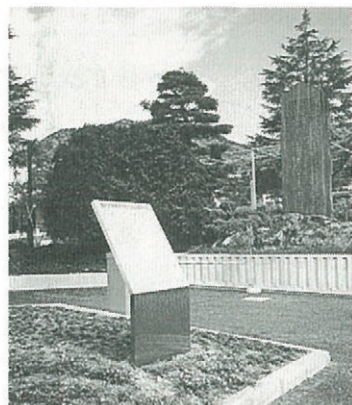
正門横の石碑と解説板

私の通うユタ大学のキャンパスを覆っていた雪も少しずつ溶け始め、春の兆しが見えてきました。こちらに留学して早くも六ヶ月が過ぎようとしています。新しい異国の地での生活は思っていた以上に大変で、辛い経験もたくさんしてきました。しかし、限られた言語能力でも他人に自分の気持ちを伝えられ理解しあえた時の喜びは、辛かった経験を忘れさせる程おきなものでした。大学での勉強はとても興味深いもので、授業形式の違い(日本の大学との)に当惑しつつも、世界的