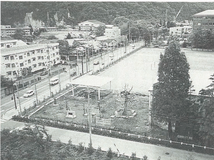
学部西校舎よりみる 附属小跡地の記念公園

平成十一年は、信州大学が創立して五十周年になります。大学また教育学部では種々記念行事を予定していますが、学部から卒業生名簿の刊行は同窓会へ依頼されました。平成七年同窓会総会で