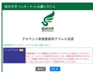
④ アカウント新規登録用メールアドレス送信