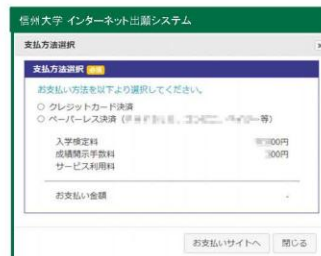
②支払方法を選択し お支払いサイトへ をクリック