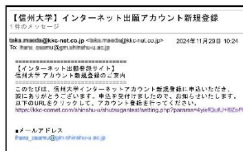
⑤ 登録したメールアドレスに登録用URLが届きます。

※@kkc-net.co.jpのドメインからのメールを受信可能に設定してください。