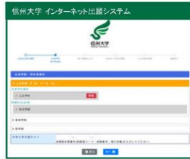
②志望学部・学科等の選択