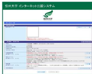
①申し込み一覧画面(*)から 写真のアップロード をクリック