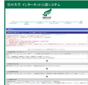
⑥登録完了 (確認メールも送信される) 申し込み一覧 をクリック