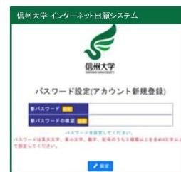
⑥ パスワードを設定してください

※@kkc-net.co.jpのドメインからのメールを受信可能に設定してください。