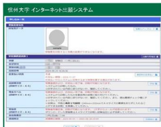
①申し込み一覧画面(*)から 検定料のお支払い をクリック