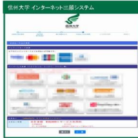
④お支払い方法の確認