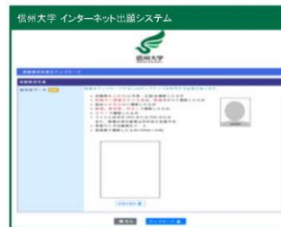
②画像を選択しアップロード