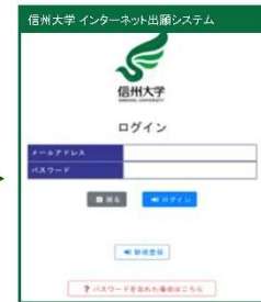
③ ログイン画面から