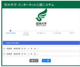
①入試区分等の選択 (検定料免除申請確認も含む)