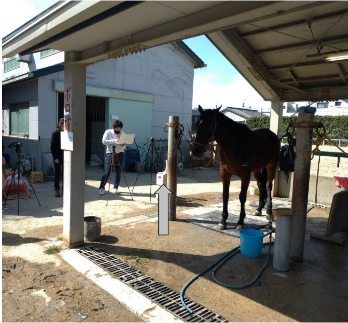
図1 飼育ウマの呼吸数測定実験のようす 矢印が、ミリ波レーダを送受信する測定器