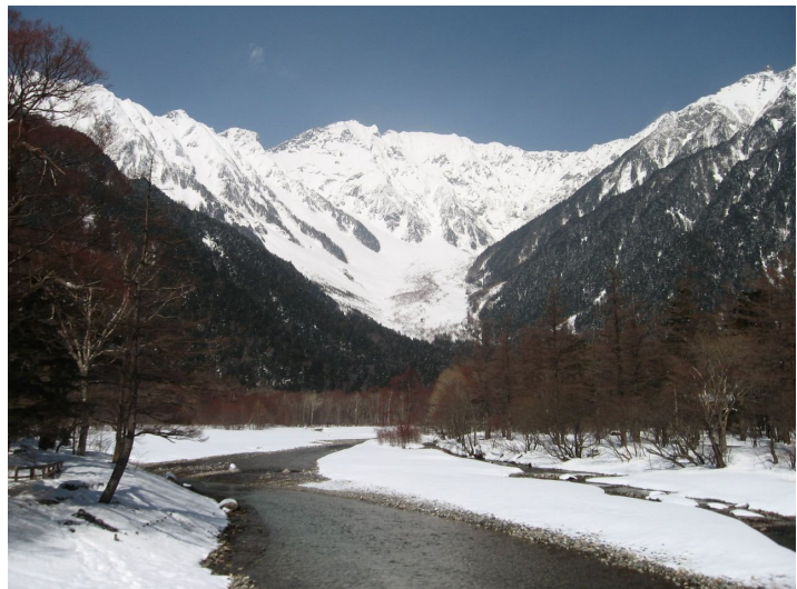
図1 厳冬季の上高地・梓川