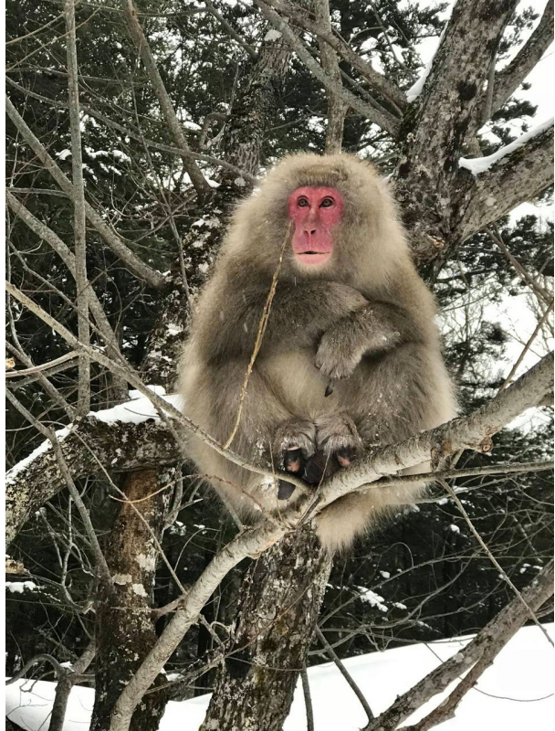
図2 上高地のニホンザル

当時、信州大学の大学院に在籍していた竹中將起博士（現在は筑波大学・生命環境系の特任助教）らも参画した研究チームが上高地での共同研究を展開する中で、ミルナー教授より、上高地のニホンザルが行う「川干し」行動は世界的にはほとんど知られておらず、科学的な調査・研究を実施するべきであるとの提案がなされ、ニホンザル糞サンプルから、厳冬季の食性を解明するための DNA メタバーコーディング解析に着手しました。