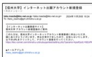
⑤ 登録したメールアドレスに 登録用URLが届きます。 ※@kkc-net.co.jpのドメインからのメール を受信可能に設定してください。