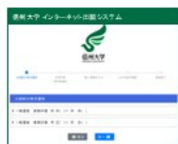
①入試区分等の選択 (検定料免除申請確認も含む)