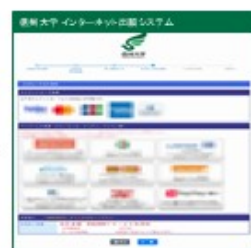
④お支払い方法の確認