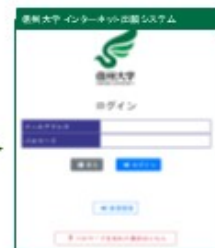
③ ログイン画面から ➡ 新規登録 をクリック