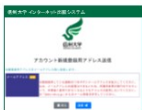
④ アカウント新規登録用 メールアドレス送信