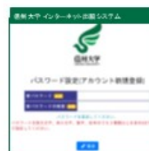
⑥ パスワードを設定してください