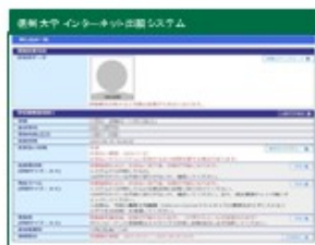
①申し込み一覧画面(※)から 検定料のお支払い をクリック