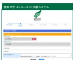
②志望学部・学科等の選択