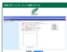
②画像を選択しアップロード