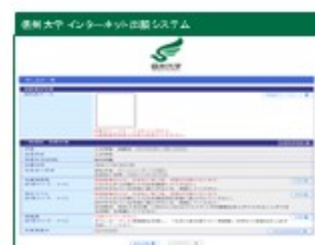
①申し込み一覧の画面(※)から 写真のアップロード をクリック