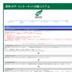
⑥登録完了 (確認メールも送信される) 申し込み一覧 をクリック