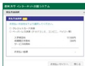
②支払方法を選択し お支払いサイトへ をクリック