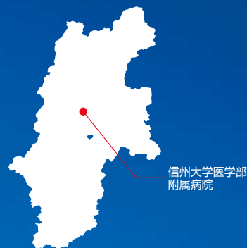
信州大学医学部 附属病院

卒後3年目からは、医師としてやりがいのある人生を、是非、この信州の地でお送りください。