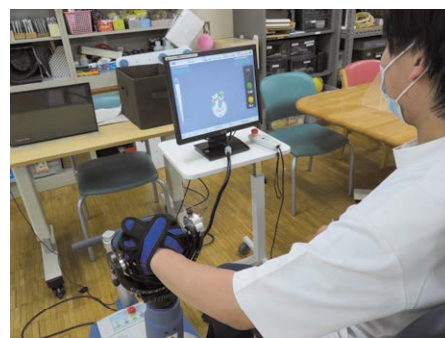
上肢型リハビリテーションロボット