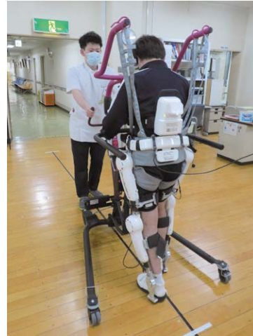
下肢型リハビリテーションロボット

高齢化が進み社会構造が大きく変化したことに加え、“人生100年時代”の到来とも言われる超高齢化社会が現実味を帯びています。しかし、健康寿命は期待されているほど伸びておらず、何らかの障害を持って生活する数年以上の期間(平均寿命－健康寿命)における医療・介護が大きな社会問題となっています。このような社会情勢を踏まえリハビリテーションは、今後ますます重要性が増してくると考えられています。リハビリテーション医療は、脳血管障害、神経疾患、運動器疾患、循環器疾患、内部障害(消化器や腎臓疾患など)、小児疾患およびがんなど、対象となる疾患や病態が多岐にわたる特徴を有しています。また、縦断的に急性期、回復期、生活期すべてに関わりを持っている医療分野で、今後はますます社会的ニーズが高まると考えられている診療科です。リハビリテーション科医は各診療科からリハビリテーション依頼を受け、患者さんの病状を評価したのち、治療目標・治療計画を立案しリハビリテーション処方を行います。実際の療法はリハビリテーション専門職(理学療法士、作業療法士、言語聴覚士)が中心となって行いますが、療法中にも目標変更やリスク管理などを行い、患者さんの在宅・社会復帰を目指します。