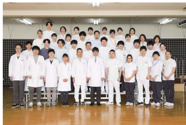
リハビリテーション部スタッフ