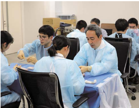
2019年 Shinshu Surgical Skill Up Seminar 真皮縫合、腸管吻合トレーニング

専攻医は専門研修施設群内の施設で専門研修指導医のもとで研修を行い、専門研修指導医は、専攻医が偏りなく到達(経験)目標を達成できるように配慮します。専攻医は、定期的開催される症例検討会やカンファレンス、抄読会、CPCなどに参加します。また、臨床現場以外でも知識やスキル獲得のため学会やセミナーに参加します。セミナーには学会主催または専門研修施設群主催の教育研修(医療安全、感染対策、医療倫理、救急など)、臨床研究・臨床試験の講習(eラーニングなど)、外科学の最新情報に関する講習や大動物(ブタ)を用いたトレーニング研修が含まれます。