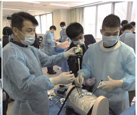
2020年 伊那中央病院と共同開催 気管支形成・胸腔鏡手術トレーニング