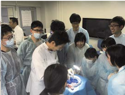
2019年 心外道場 ブタの心臓を使ったAVRトレーニング