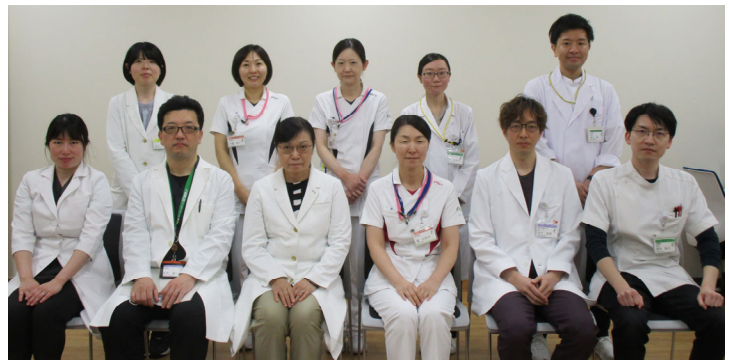
2025年度 緩和ケアチーム