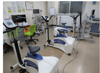
心臓リハビリテーション室