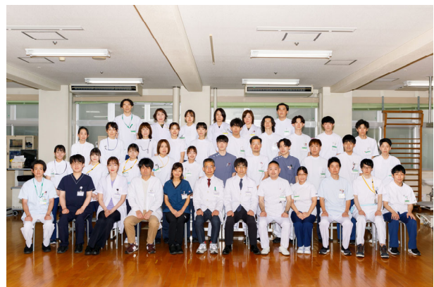
リハビリテーション科&リハビリテーション部スタッフ