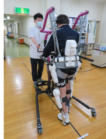
下肢型リハビリテーションロボット

本邦は高齢化が進み社会構造が大きく変化したことに加え、“人生100年時代”の到来とも言われる超高齢社会となっています。しかし、健康寿命は期待されているほど伸びておらず、何らかの障害を持って生活する数年から10数年の期間(平均寿命 - 健康寿命)において医療・介護が大きな社会問題となっています。このような社会情勢を踏まえるとリハビリテーション科医は、今後ますます重要性が増してくると考えられています。リハビリテーション医療は、脳血管障害、神経疾患、運動器疾患、循環器疾患、内部障害(消化器や腎臓疾患など)、小児疾患およびがんなど、対象となる疾患や病態が多岐にわたる特徴を有しています。また、縦断的に急性期、回復期、生活期すべてに関わりを持っている医療分野で、今後はますます社会的ニーズが高まると考えられています。リハビリテーション科医は各診療科からリハビリテーション依頼を受け、患者さんの病状を評価したのち、治療目標・治療計画を立案しリハビリテーション処方を行います。実際の療法はリハビリテーション専門職(理学療法士、作業療法士、言語聴覚士)が中心となって行いますが、療法中にも担当医として目標変更やリスク管理などを行い、患者さんの在宅・社会復帰を目指します。