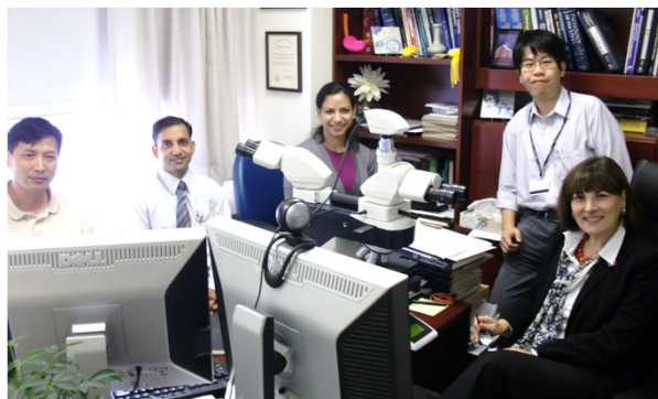
ペンシルバニア大学と研究室風景