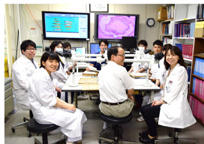
毎朝の病理診断科症例検討会の光景

研究分野では消化管病理の研究を始め、様々な分野での臨床医とのコラボレーションが行われています。また当科ならび検査部門には40名以上の臨床検査技師がおり、様々な技術や知見を有しています。彼らとの共同研究も盛んに行われています。大学院進学は随時可能です。