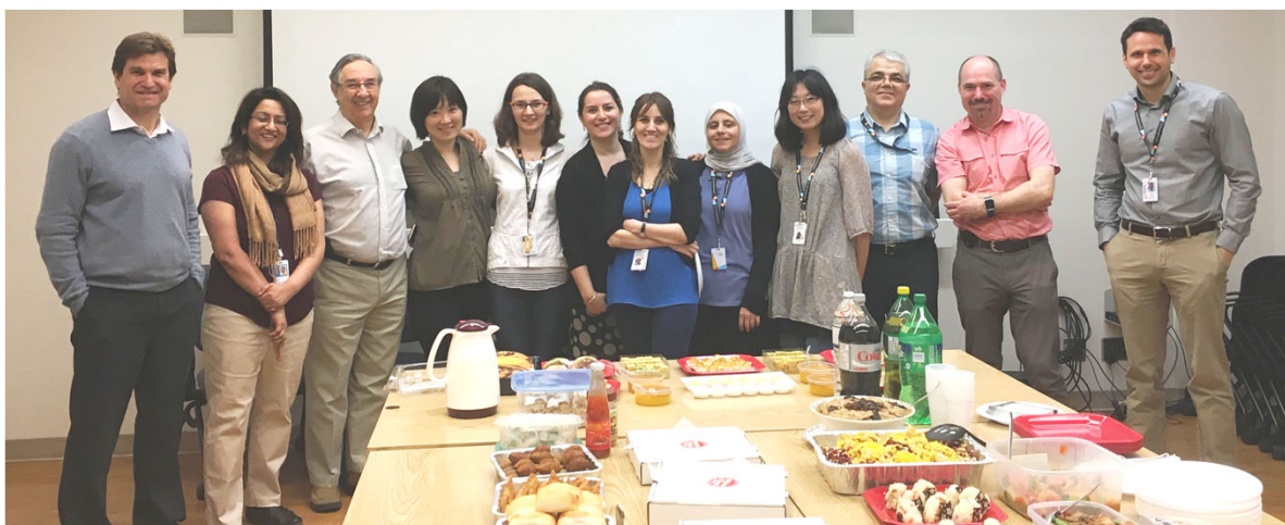
マウントサイナイ病院 消化器病理スタッフ、フェローとレジデント