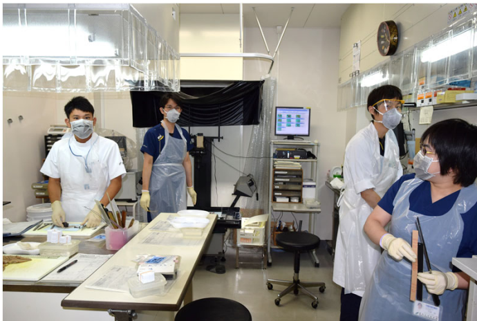
後期レジデントによる手術材料の切り出し風景