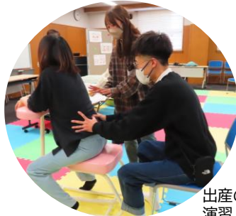
出産のサポートの演習