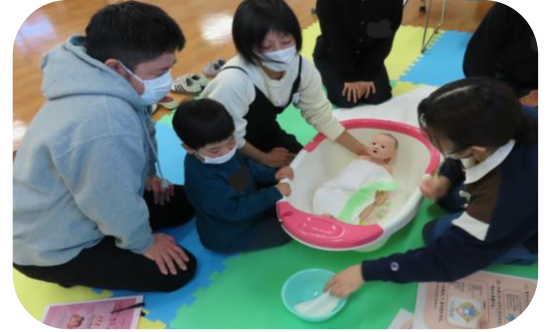
家族そろって赤ちゃん人形を使った沐浴の演習 ～助産師や学生が家族に付きまます～

「エコーで上の子どもたちと赤ちゃんの様子を見れたことが印象に残っています。家族で赤ちゃんを迎える準備が整った。」 (経産婦パートナーさん)