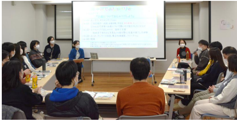
参加者の自己紹介からスタート