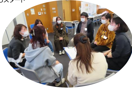
小グループでの「おしゃべり」