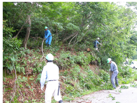
黒岩山での環境全作業

このような状況の中で、本州から一時いなくなったと考えられていた里山のチョウ・オオルリシジミが飯山市に生息していることがわかりました。また、従来から飯山市では、黒岩山のギフチョウなど貴重な生物がいることが知られています。そこで、こうした里山の貴重な生物を紹介し、保全を考えながら、里山を子供たちともども楽しみ活用する方法を市民のみなさんと一緒に考えていくために、「北信濃里山シンポジウム」を開催します。