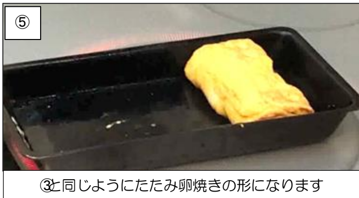
⑤と同じようにたたみ卵焼きの形になります