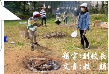
題字:副校長 文責:教頭

自然体験園、校庭東側の芝の伸び具合が、ここにきて増し始めました。残念ながらすべてが芝とは言えませんが、5月のはじめに蒔いた肥料の効果かと思えます。伸びよう伸びようとする芝たちが、身を伸ばすための肥料を求めていた証拠です。「もっと成長したい」と願う子どもたちと同じような気がします。