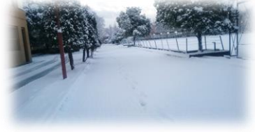
題字：副校長 文責：教頭

子どもたちにとっては楽しい『雪』の季節が到来しました。先週16日には数cm、翌日には10cmほどの降雪があり、ランドセルを教室へ置くと、一人また一人と、雪が積もりだした白銀の世界へと飛び出す姿がありました。