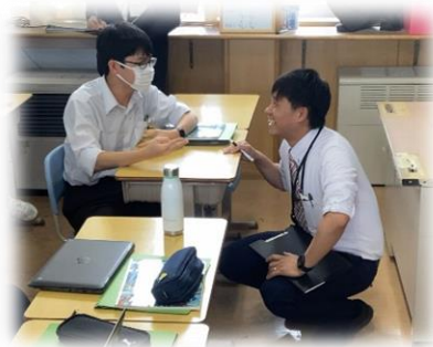
メモに整理している様子