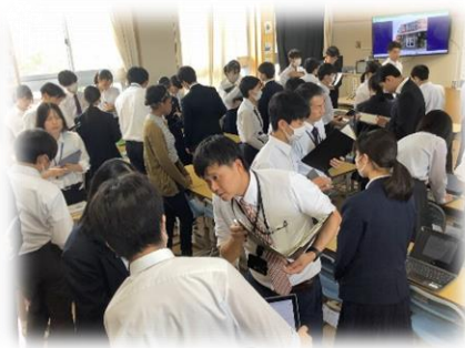
発表し合っている様子