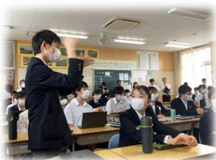
考えを共有している様子

今後は、Lesson Goal (日本に来たいと思っている外国人に向けて、本当に知ってほしい日本をPRしよう) に対する自分の考えについて、本時学んだことを生かし、考えをまとめ、友と感想を伝え合ったり、PRビデオとして記録に残したりしていきます。