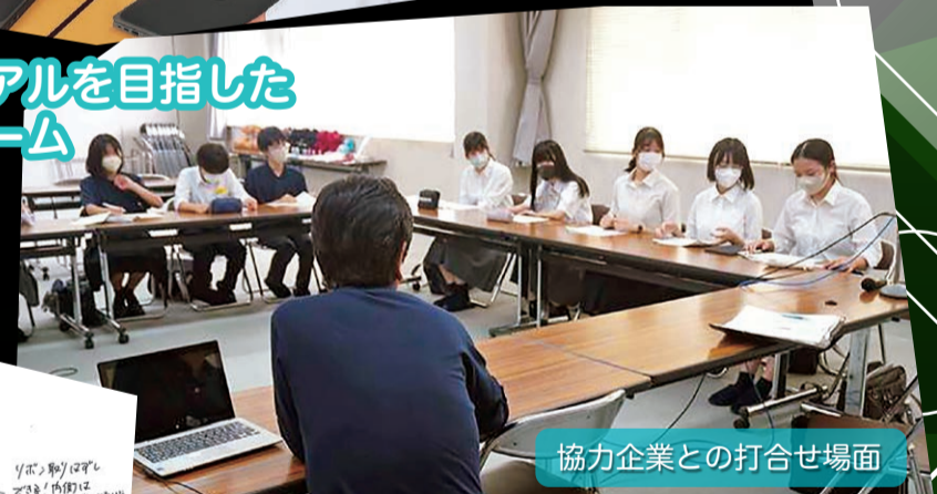
協力企業との打合せ場面