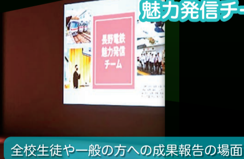
全校生徒や一般の方への成果報告の場面