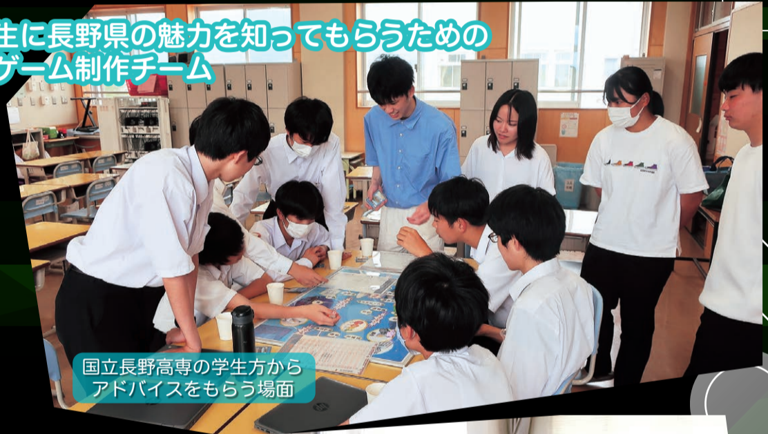
国立長野高専の学生方から アドバイスをもらう場面