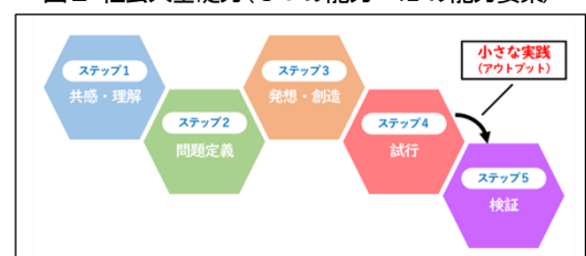
図3 デザイン思考と小さな実践（アウトプット）

次に、STEAM教育等の教科等横断的な学習の推進について（令和5年5月）には、STEAM教育を「各教科等での学習を実社会での問題発見・解決に生かしていくための教科等横断的な学習」と示されている。そこで、本校では「STEAM教育」は、教科の枠を超えて、実生活・実社会の諸課題（正解のない問い、最適解・納得解など）を解決する学習と捉えた。そして、実生活・実社会の諸課題に対して、「デザイン思考」で見いだした解決策を、実生活・実社会に近い環境で実践する「小さな実践（アウトプット）」を位置付けた学習を構想・実践することで、その具現に迫れると考えた（図3）。