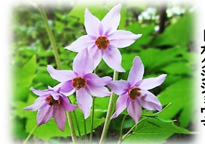
トガクシシユウマ