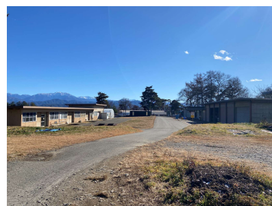
附属施設・農場等

1契約15万円(税抜)/年～ ※ポスター等を設置する場合は別途費用が発生します。