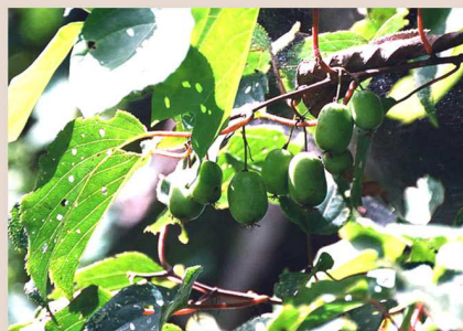
サルナシ（コクワ）の実 秋の食用・薬用植物も豊富

自然が好き・・・だけでいいですか？ フィールドを見るプロのこつ、 少しだけ教えます。