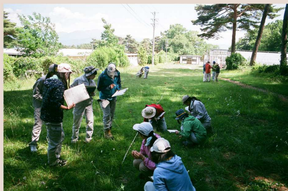
農場での植生調査のひとコマ

自然が好き・・・だけでいいですか？ フィールドを見るプロのこつ、 少しだけ教えます。