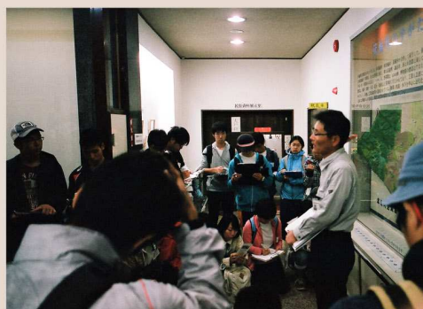
箕輪町・郷土博物館での見学