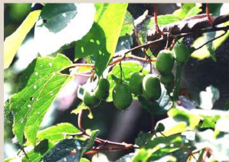
サルナシ（コクワ）の実 秋の食用・薬用植物も豊富

自然が好き・・・だけでいいですか？ フィールドを見るプロのこつ、 少しだけ教えます。