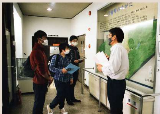
箕輪町・郷土博物館での見学