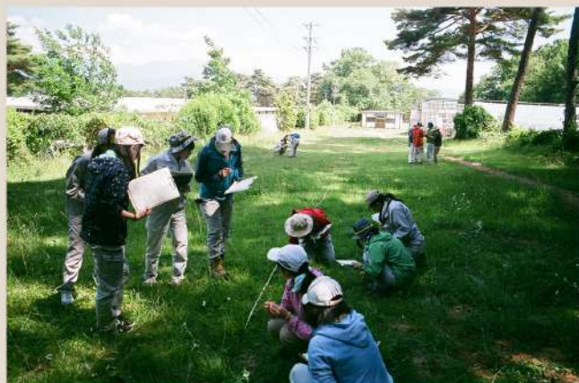
農場での植生調査のひとつコマ

自然が好き・・・だけでいいですか？ フィールドを見るプロのこつ、 少しだけ教えます。