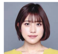
タレント 兼エンジニア 池澤あやかさん

13:30 ~ 14:30 1ステージ (予定) 松本Mウイング6階ホール 見本市特設ステージ