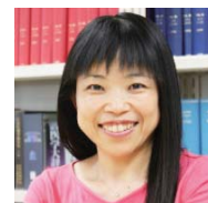
信州大学 バイオメディカル研究所 増木静江 教授