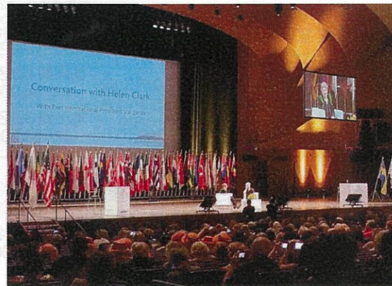
国際ゾンタ第64回世界大会 Yokohama