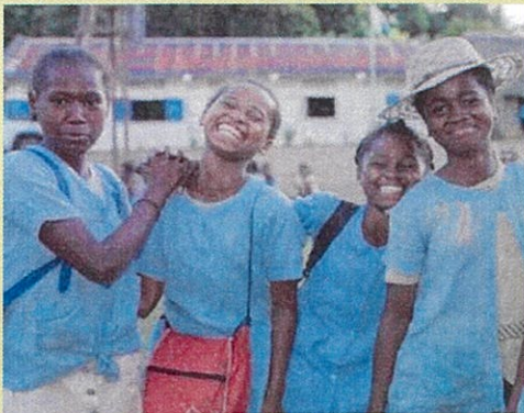
マダガスカル 思春期少女の一体型プログラム