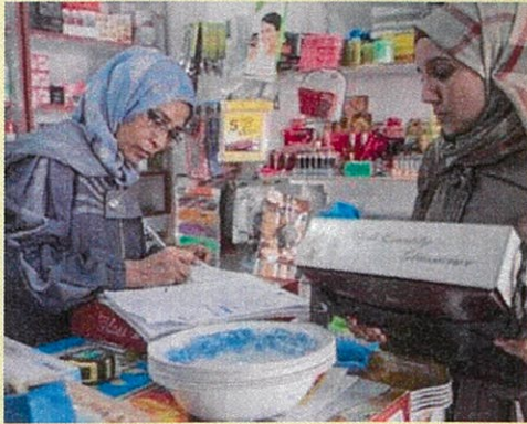
Eid bi Eid ヨルダン シリア難民とヨルダンの立場の弱い女性の回復力とエンパワメントの向上を図るプログラム