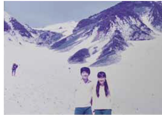
テニス同好会の先輩・後輩として出会った二人。学生時代から共に人生を歩んできた。

自宅は上田で、ウィークデーは松本に単身赴任中。能力ある女性の可能性を伸ばすには男性の力が必要だと考えている。スマホ世代の若者たちが生のコミュニケーション力に欠けることが最近の気がかりだ。