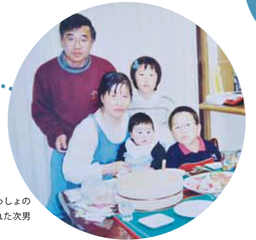
上田でやっと家族いっしょの生活。このとき生まれた次男も大学生になった。