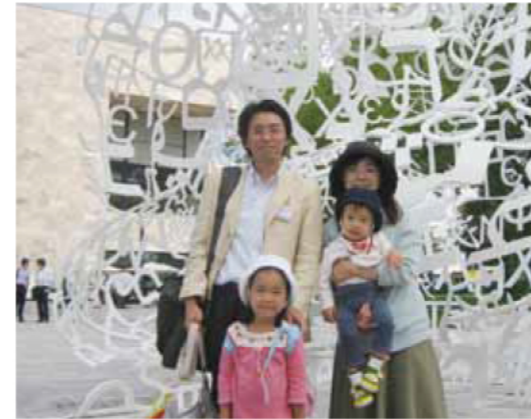
高校の音楽教諭を務める妻と7歳の長女、3歳の長男の4人暮らしです。妻の両親が市内に住んでいるもの、なるべく頼らないように努めています。