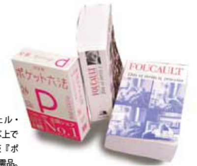
現在の研究テーマであるミシェル・フーコーの哲学書と、法学を学ぶ上では欠かせない六法全書の小型版『ポケット六法』は、研究の上での必需品。

べき点が多々あります。例えば、婚姻最低年齢は男性が18歳、女性が16歳。他国は近代に入って同年齢に統一されているのに対し、日本はなかなか変わりません。これを変えるのは教育による国民意識の変革しかない。私が教育学部にいる意義はそこにあります。その上で、講義でも学生たちが考えることを重視し、模擬裁判形式の授業をよく行っています。最近では、エホバの証人の信者の輸血拒否の事例や、未成年の犯罪者の氏名や顔写真が雑誌に掲載された少年法の事例などを扱いました。学生をチームに分けて討論をさせると、それぞれが真剣に考えて取り組みます。私から何かを教えたり、示したりすることで、学生に覚えてもらう授業は好きではありません。だから、このように研究を教育に活かすよう工夫しています。