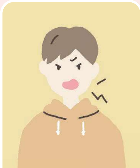
怒りやすくなった