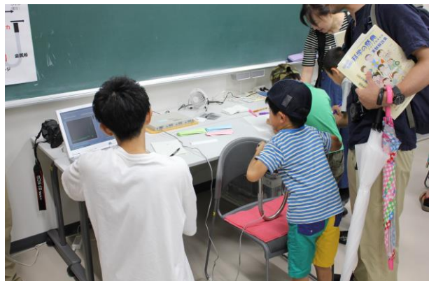
腕力測定の様子 (2019青少年のための科学の祭典)