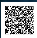
専用申し込みフォーム