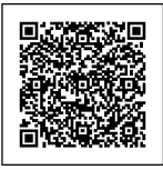
専用申し込みフォーム

参加を希望される方は、事前に下記専用フォームからお申し込みいただくか、または氏名、所属／部署名(役職)、連絡先(電話番号・メールアドレス)を明記の上、下記メールアドレス・FAXよりお申し込みください。