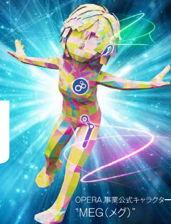
OPERA 事業公式キャラクター “MEG(メグ)”