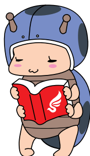
工学ナナちゃん 信州大学附属図書館マスコットキャラクター